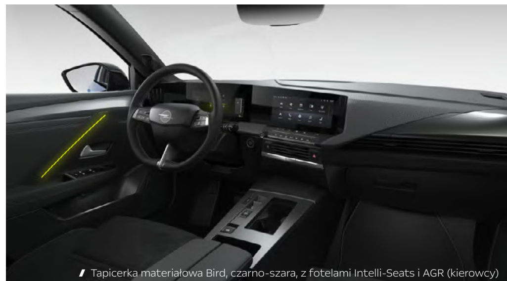
/ Tapicerka materiałowa Bird, czarno-szara, z fotelami Intelli-Seats i AGR (kierowcy)