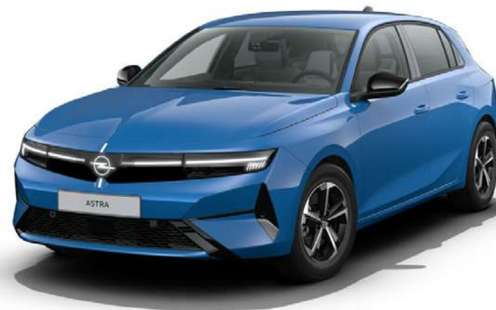
// Lakier niebieski Athletic // Felgi 16" Admiral