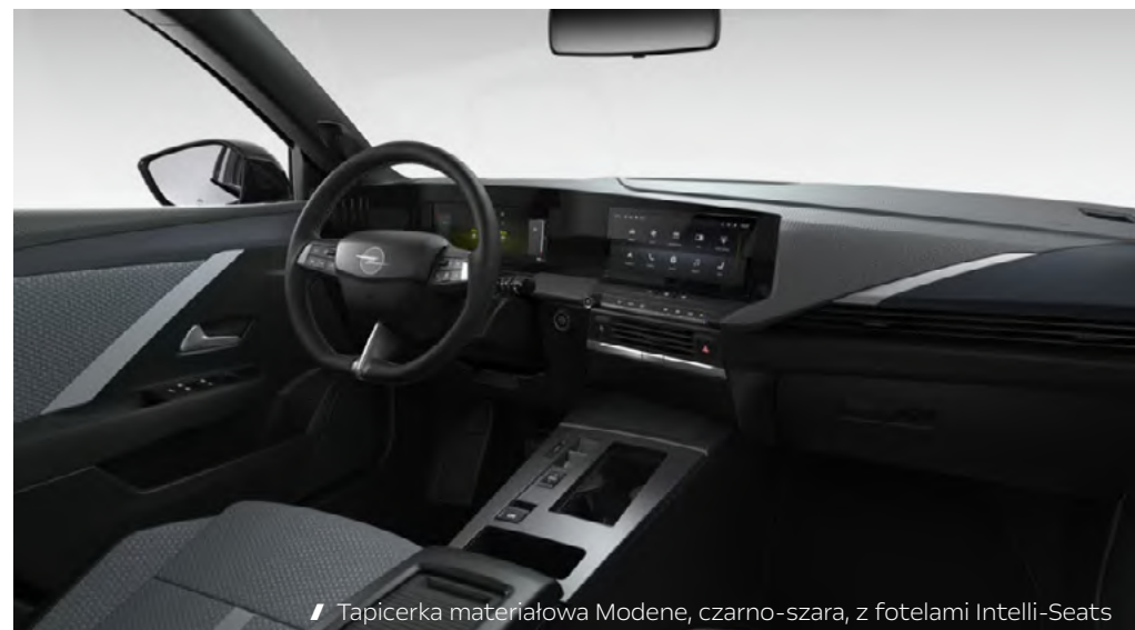
// Tapicerka materiałowa Modene, czarno-szara, z fotelami Intelli-Seats