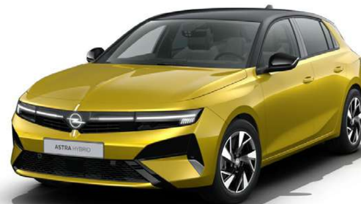
// Lakier żółty Kult // Felgi 17" Kadett