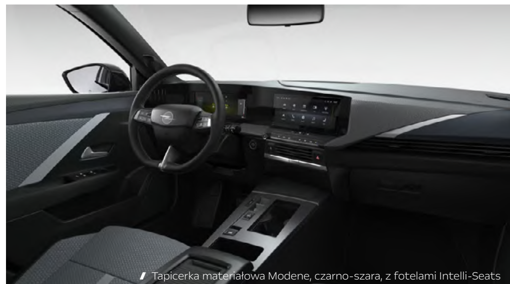
/// Tapicerka materiałowa Modene, czarno-szara, z fotelami Intelli-Seats