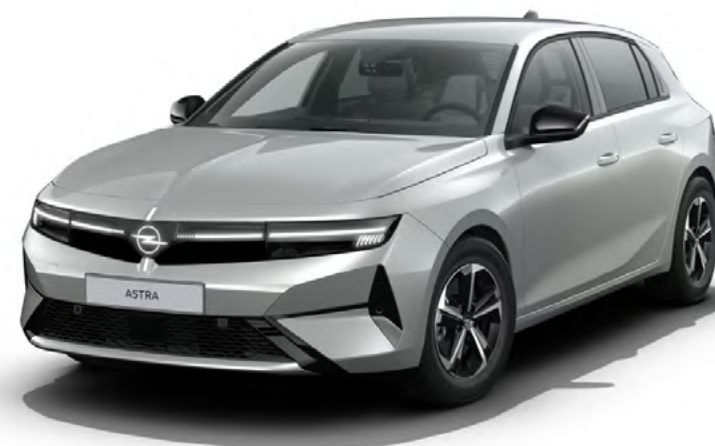
/// Lakier srebrny Kristall // Felgi 16" Admiral