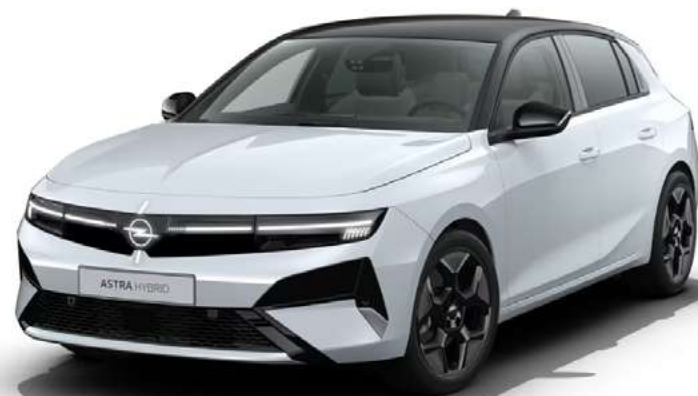
/ Lakier biały Kontur / Felgi 18" Pentagon