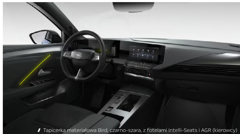
// Tapicerka materiałowa Bird, czarno-szara, z fotelami Intelli-Seats i AGR (kierowcy)